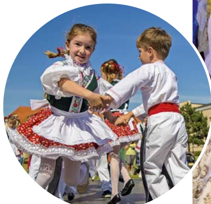
MFF Štepy Veselí nad Moravou

Ludová kultúra, tradície i remeslá v krajine okolo Baťovho kanálu stále žijú v každej dedine a sú súčasťou každodenného života ich obyvateľov.