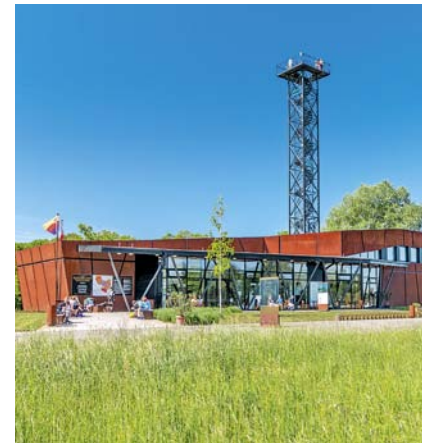
Slovanské hradisko v Mikulčiciach

Významným strediskom kultúry v regióne je mesto Strážnice , ktorého historické centrum je mestskou pamiatkovou zónou. Navštíviť tu môžete zámok s rozsiahlym anglickým parkom so vzácnou platanovou alejou alebo miestny skanzen. Známe sú tiež strážnické brány nachádzajúce sa pri prejazde mestom na oboch stranách hlavnej cesty ako mohutné opevnenie mesta zo 16. storočia. Čaro barokovej kultúry môžete pre zmenu pozorovať na zámku Milotice . Tento unikátne zachovaný komplex barokových stavieb a záhradnej architektúry je taktiež nazývaný „perla Juhovýchodnej Moravy“. Súčasťou zámockého areálu je aj pozíčovňa historických kostýmov a jazdiareň s detskou expozíciou. V regióne nájdete tiež pamiatky a historicky významné miesta spojené s obdobím Veľkomoravskej ríše, ktorej centrum sa v ranom stredoveku nachádzalo na území regiónu Slovácko. Za návštevu určite stojí Slovanské hradisko v Mikulčiciach . Toto hradisko predstavuje najrozsiahlejšie slovanské archeologické nálezisko v Českej republike. Peší návštevnícky okruh ponúka prechádzku okolo kniežacieho paláca a základov 12 kostolov. Nedaleko hradiska bola vybudovaná nová