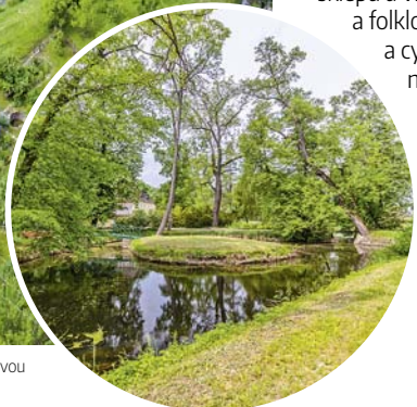
Veselí nad Moravou